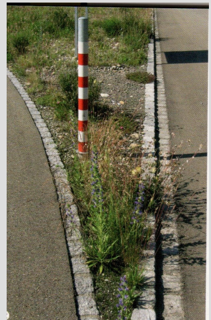
Ambienti ruderali: angolo fra due strade, in cui crescono la cicoria comune e la piantaggine (sopra), porzione di cava temporaneamente dismessa (a sinistra).